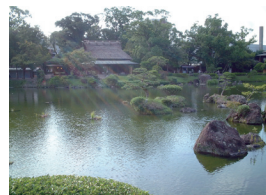
66-2 Suizenji-Syōsyūen 熊本 水前寺成趣園

Kumamoto, Kumamoto Prefecture 熊本県熊本市 <熊本城(特別史跡)の本丸北西隅の高石垣上に建つ現 存の宇土櫓(重要文化財)>