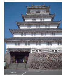
65-1 Donjon, Simabara Castle 島原城天守

Simabara, Nagasaki Prefecture 長崎県島原市 <復興された天守>