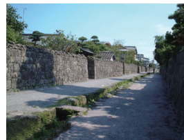
65-2 Samurai Residences, Simabara Castle Town 島原城下武家屋敷

Simabara, Nagasaki Prefecture 長崎県島原市 <復興された天守>