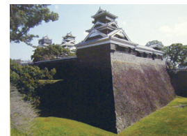
66-1 Uto Tower, Kumamoto Castle 熊本城宇土櫓

Kumamoto, Kumamoto Prefecture 熊本県熊本市 <熊本城(特別史跡)の本丸北西隅の高石垣上に建つ現 存の宇土櫓(重要文化財)>