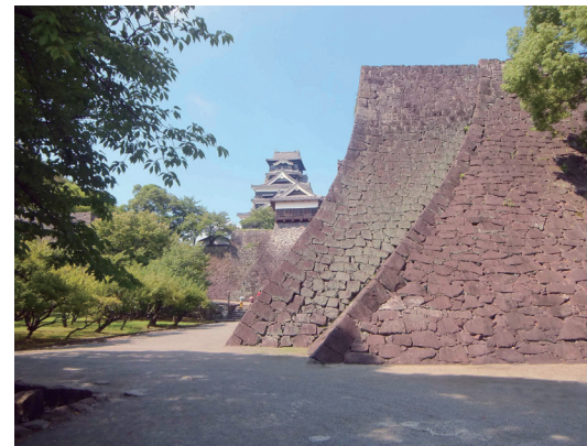
熊本城本丸下の二重の石垣（右が加藤時代、左が細川時代）