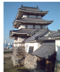
53-1 Takamatsu Castle 高松城の櫓

Takamatsu, Kagawa Prefecture 香川県高松市 <直接海に面していた北の丸月見櫓と手前の水手御門 (いずれも重要文化財)>