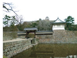
54-2 Main Gate, Marugame Castle 丸亀城大手門

Marugame, Kagawa Prefecture 香川県丸亀市 <高石垣の城郭の上に建つ現存の天守(重要文化財)>