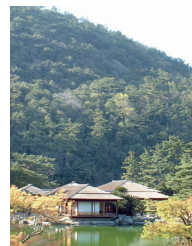
53-2 Riturin Park, Takamatsu Castle Town 高松城下栗林公園

Takamatsu, Kagawa Prefecture 香川県高松市 <直接海に面していた北の丸月見櫓と手前の水手御門 (いずれも重要文化財)>