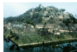
54-1 Stone Wall and Donjon, Marugame Castle 丸亀城の石垣と天守

Marugame, Kagawa Prefecture 香川県丸亀市 <高石垣の城郭の上に建つ現存の天守(重要文化財)>